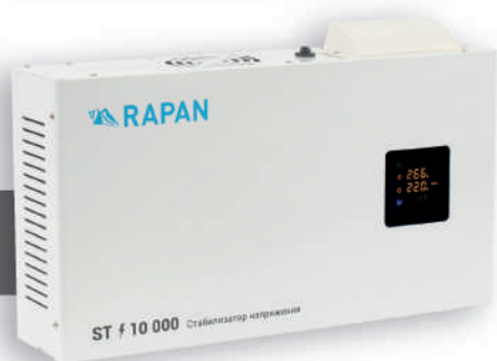
RAPAN ST-10000 452x247x103 мм