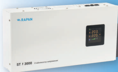
RAPAN ST-3000 RAPAN ST-5000 452x247x103 мм