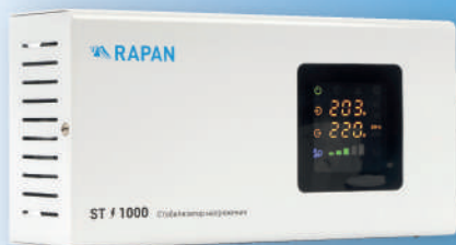
RAPAN ST-1000 250x125x75 мм