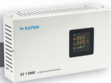
RAPAN ST-2000 272x162x66 мм