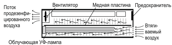
Рисунок 1 — Принцип работы рециркулятора

Рециркулятор является облучателем закрытого типа, в котором частицы потока воздуха, создаваемого вентилятором, проходят через замкнутое пространство ограниченное медной пластиной (для пассивной дезинфекции поверхностей внутреннего объема в выключенном состоянии) и в течении нескольких секунд облучаются УФ-лампой, в результате чего происходит уничтожение (обеззараживание) бактерий и вирусов (в том числе и COVID-19).