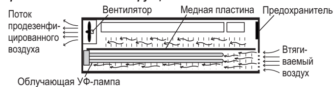
Рисунок 1 — Принцип работы рециркулятора

Рециркулятор является облучателем закрытого типа, в котором частица потока воздуха, создаваемого вентилятором, проходят через замкнутое пространство ограниченное медной пластиной (для пассивной дезинфекции поверхностей внутреннего объема в выключенном состоянии) и в течении нескольких секунд облучаются УФ-лампами, в результате чего происходит уничтожение (обеззараживание) бактерий и вирусов (в том числе и COVID-19).