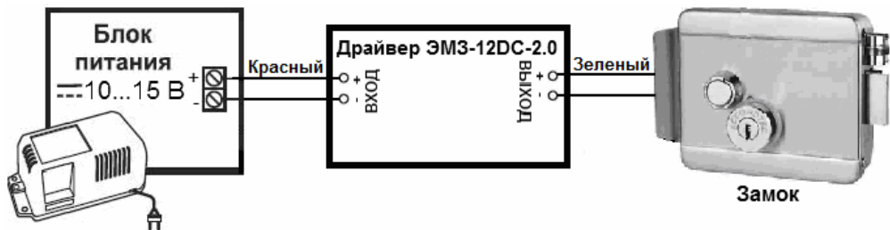
Рисунок 1 — Вариант подключения драйвера