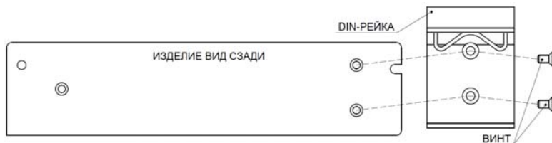
Рисунок 2 – крепление DIN-рейки

Изделие может устанавливаться на горизонтальные и вертикальные поверхности. Также может крепиться на DIN-рейку с помощью специального крепежа, входящего в комплект поставки.