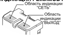
Рисунок 1 — Индикация режимов работы

В диапазоне входных напряжений от 165 В до 260 В, при правильной фазировке и отсутствии напряжения между «Землей» и «Нулем», индикатор «СЕТЬ» горит непрерывно, если же входное напряжение меньше 165 В или больше 260 В, индикатор «СЕТЬ» начинает мигать 1 раз в секунду.